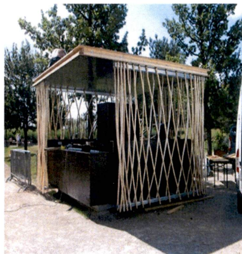
Slike: Primjeri prihvatljivog dizajna kioska za trgovinu i usluge u morskom dobru