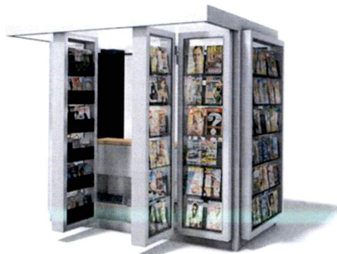
Slike: Primjeri prihvatljivog dizajna kioska za štampu u morskome dobru