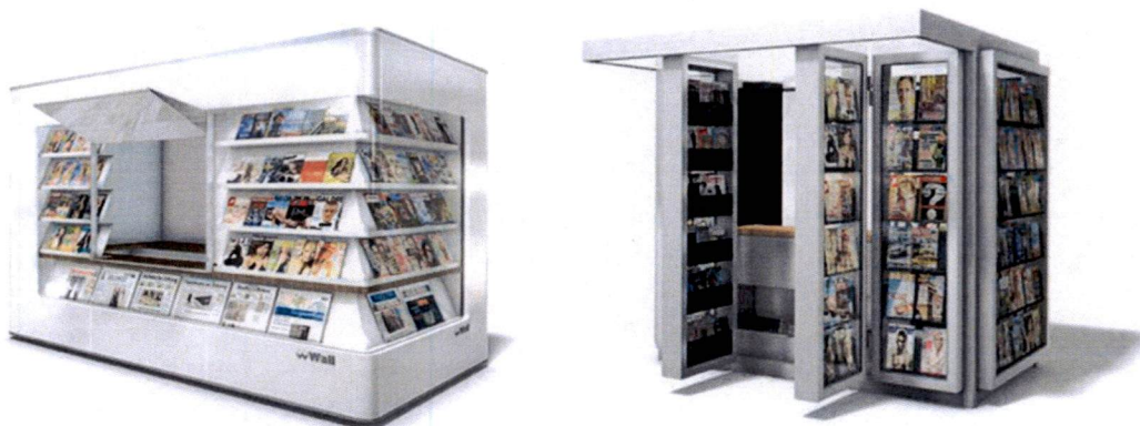
Slike: Primjeri prihvatljivog dizajna kioska za štampu u morskome dobru