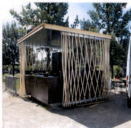
Slike: Primjeri prihvatljivog dizajna kioska za trgovinu i usluge u morskome dobru