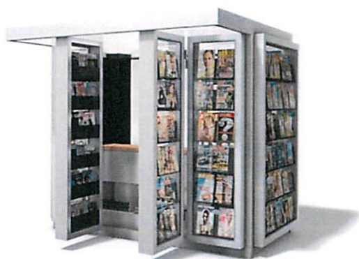
Slike: Primjeri prihvatljivog dizajna kioska za štampu u morskom dobru