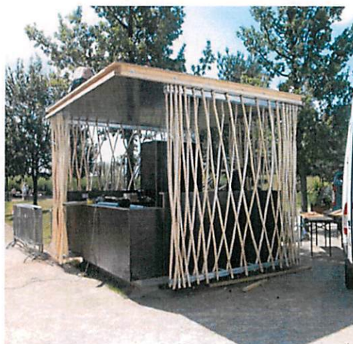
Slike: Primjeri prihvatljivog dizajna kioska za trgovinu i usluge u morskom dobru