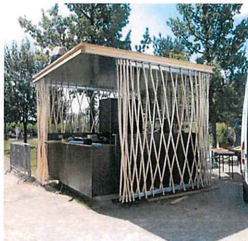
Slike: Primjeri prihvatljivog dizajna kioska za trgovinu i usluge u morskom dobru