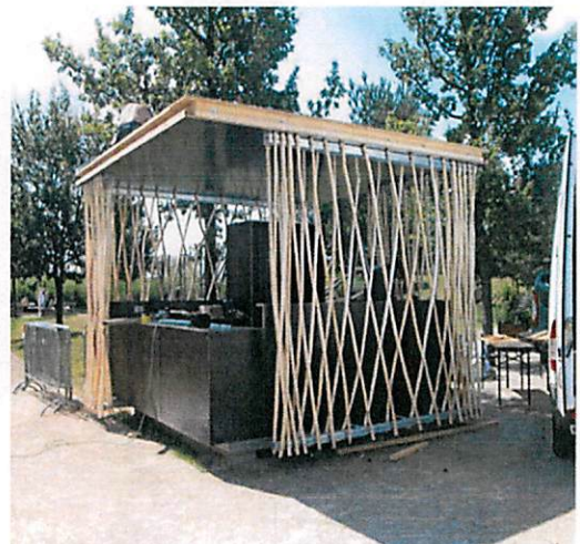
Slike: Primjeri prihvatljivog dizajna kioska za trgovinu i usluge u morskom dobru