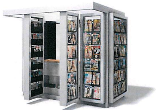
Slike: Primjeri prihvatljivog dizajna kioska za štampu u morskom dobru