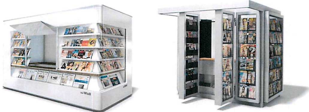
Slike: Primjeri prihvatljivog dizajna kioska za štampu u morskome dobru