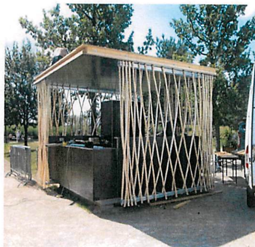
Slike: Primjeri prihvatljivog dizajna kioska za trgovinu i usluge u morskome dobru