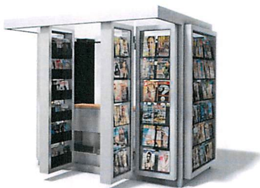
Slike: Primjeri prihvatljivog dizajna kioska za štampu u morskom dobru