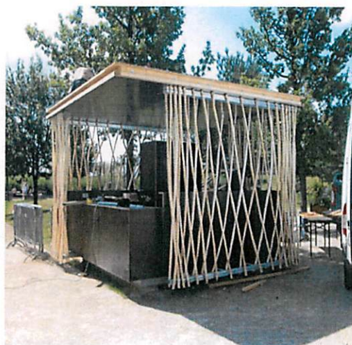
Slike: Primjeri prihvatljivog dizajna kioska za trgovinu i usluge u morskom dobru