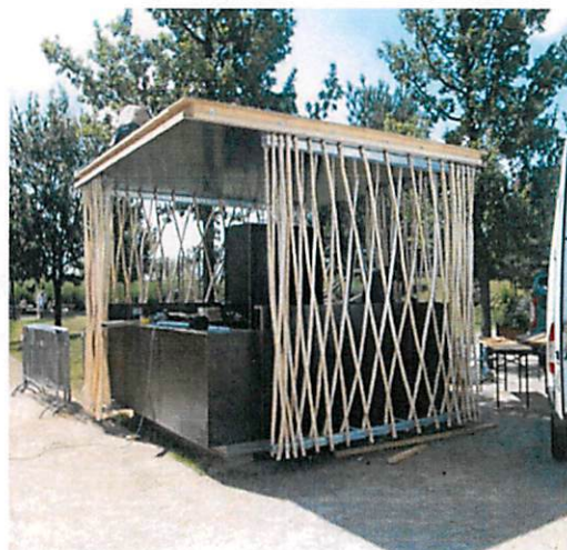
Slike: Primjeri prihvatljivog dizajna kioska za trgovinu i usluge u morskome dobru