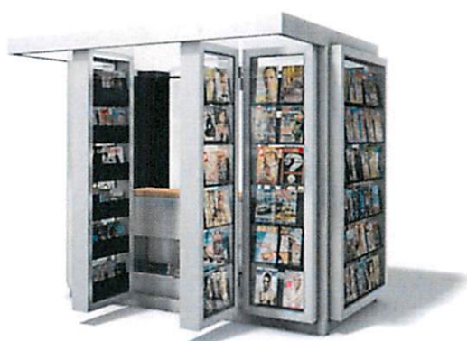
Slike: Primjeri prihvatljivog dizajna kioska za štampu u morskome dobru