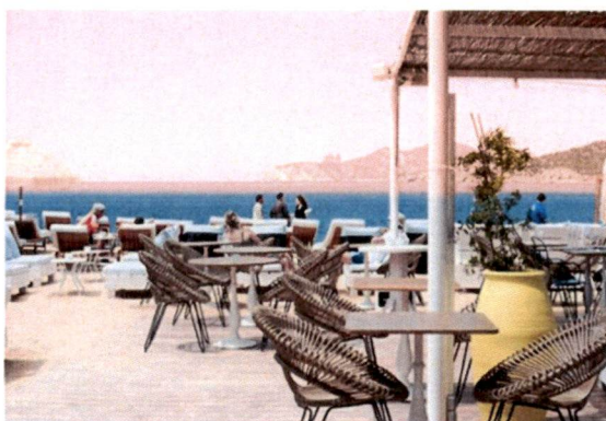
Slike: Primjer pokrivanje terasa tendom ili suncobranima.