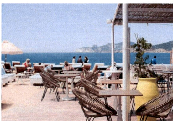
Slike: Primjer pokrivanje terasa tendom ili suncobranima.