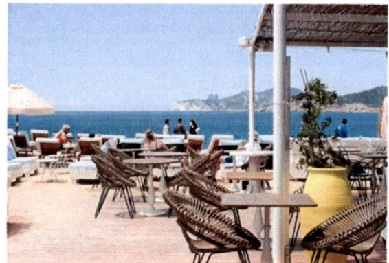
Slike: Primjer pokrivanje terasa tendom ili suncobranima.