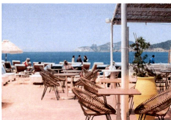
Slike: Primjer pokrivanje terasa tendom ili suncobranima.